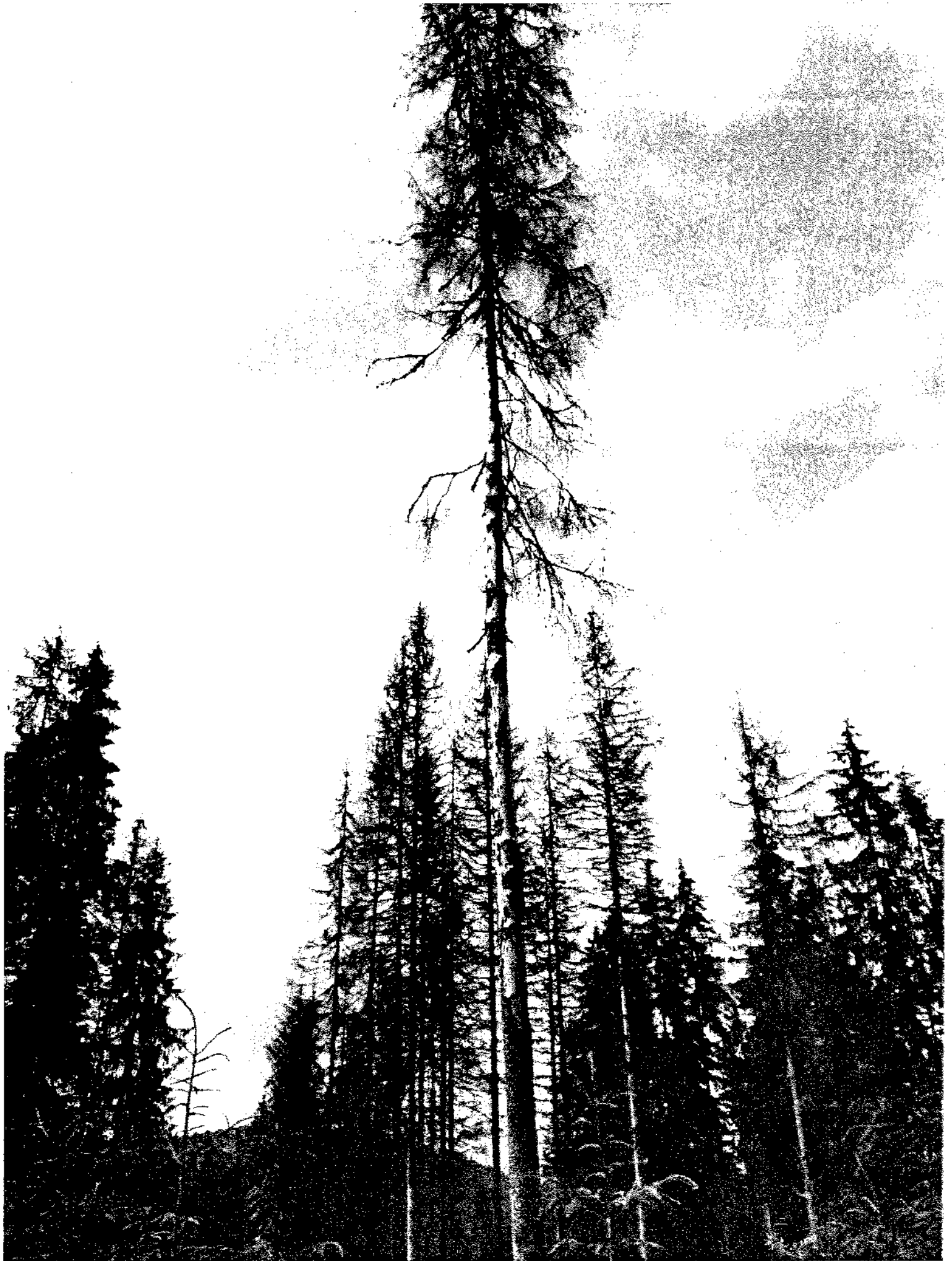
001 BOLOMO HONER No. 72A