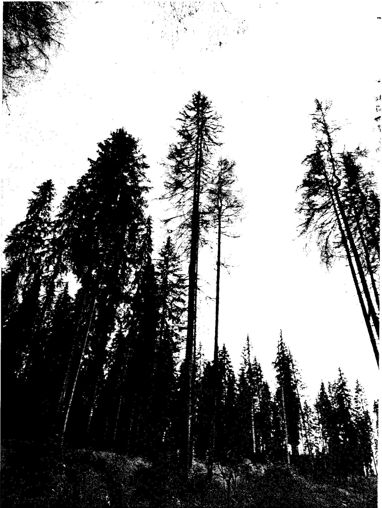
UP I POIAND HONDE NO. 72 C